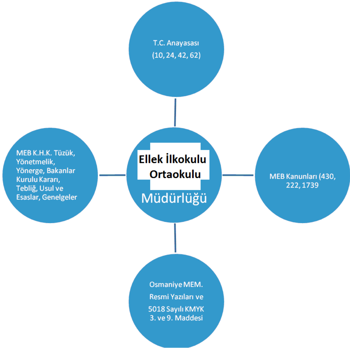
Şekil 2: Mevzuat Analiz Modeli